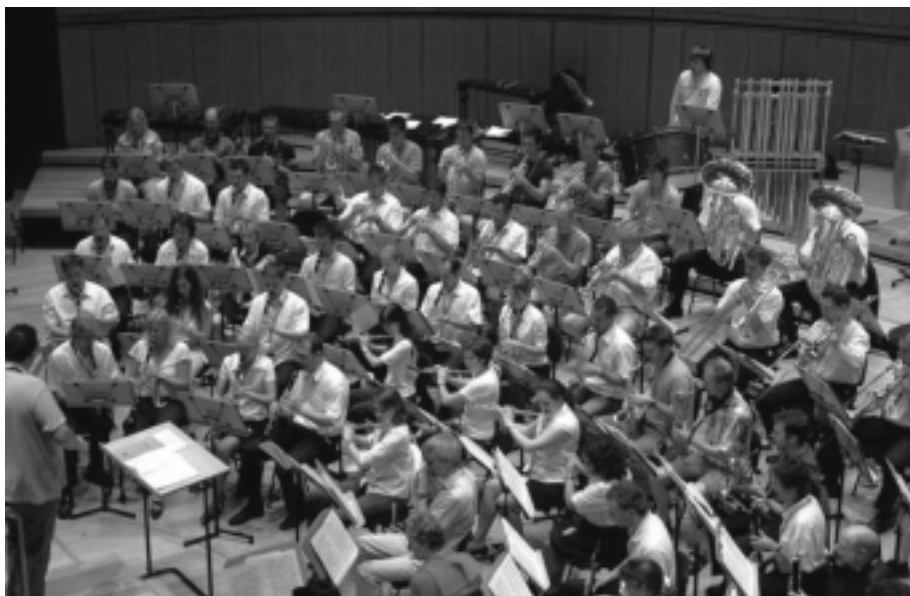
Probe der Stadtharmonie im Esplanade fürs Konzert in Singapur, 2005

gangen, eine Zeit geprägt von einer ganzen Reihe von Höhepunkten. Die Teilnahme an eidgenössischen Musikfesten führte immer wieder zu musikalischen Highlights, die Reisen ins Aus-