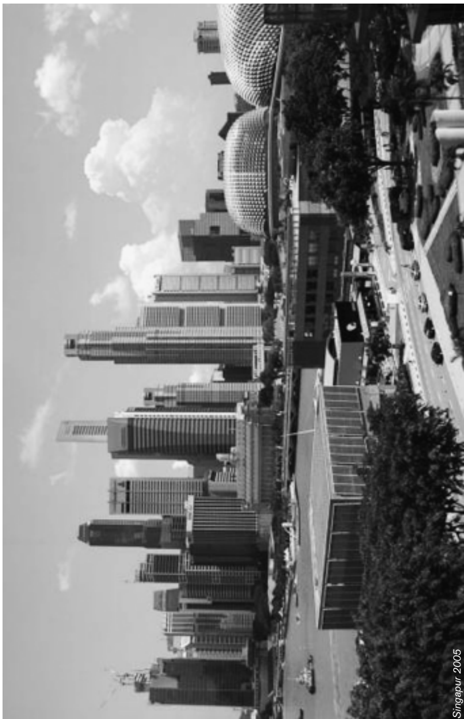
Singapur - 2005