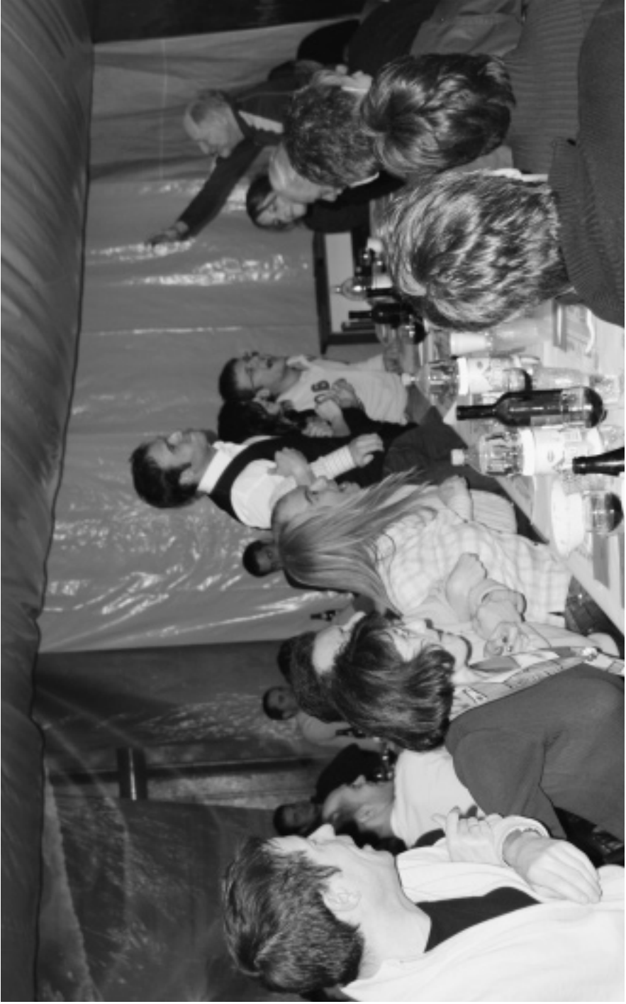
51 Ausgelassene Stimmung auf der HOS Alp